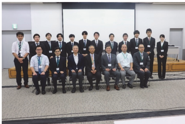
第38回シクロデキストリンシンポジウム関係者集合写真

開催のご報告を申し上げますとともに、多大なご支援を賜りました皆様に厚く御礼申し上げます。